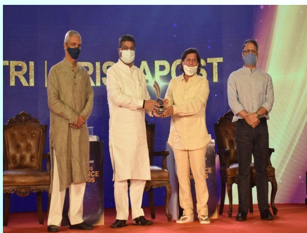
Receiving the Business Eminence Award by Dharitri and Oris-sapost from Hon'ble Minister for Petroleum & Natural Gas and Steel, Shri Dharmendra Pradhan