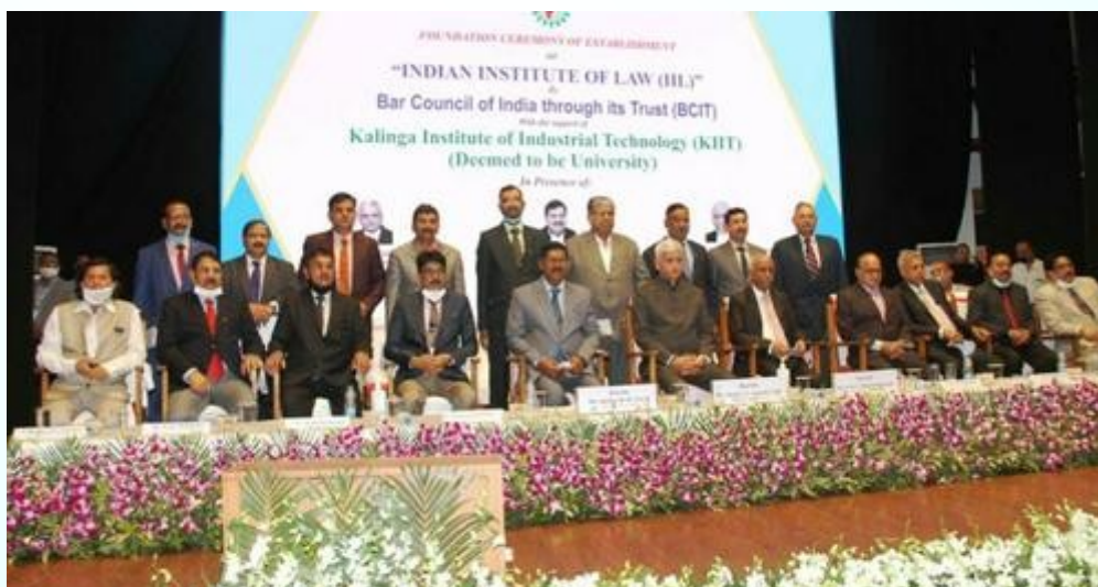
Foundation Ceremony of Establishment of Indian Institute of Law (IIL) at KIIT