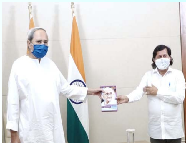
Presenting my first book "Neelimarani : My Mother My Hero" to Hon'ble CM of Odisha Shri Naveen Patnaik