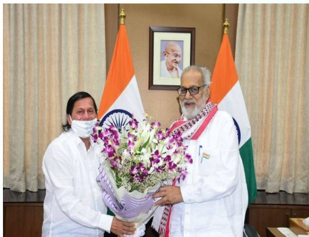
Wishing Birthday wishes to His Excellency Prof. Ganeshi Lal, Hon'ble Governor of Odisha