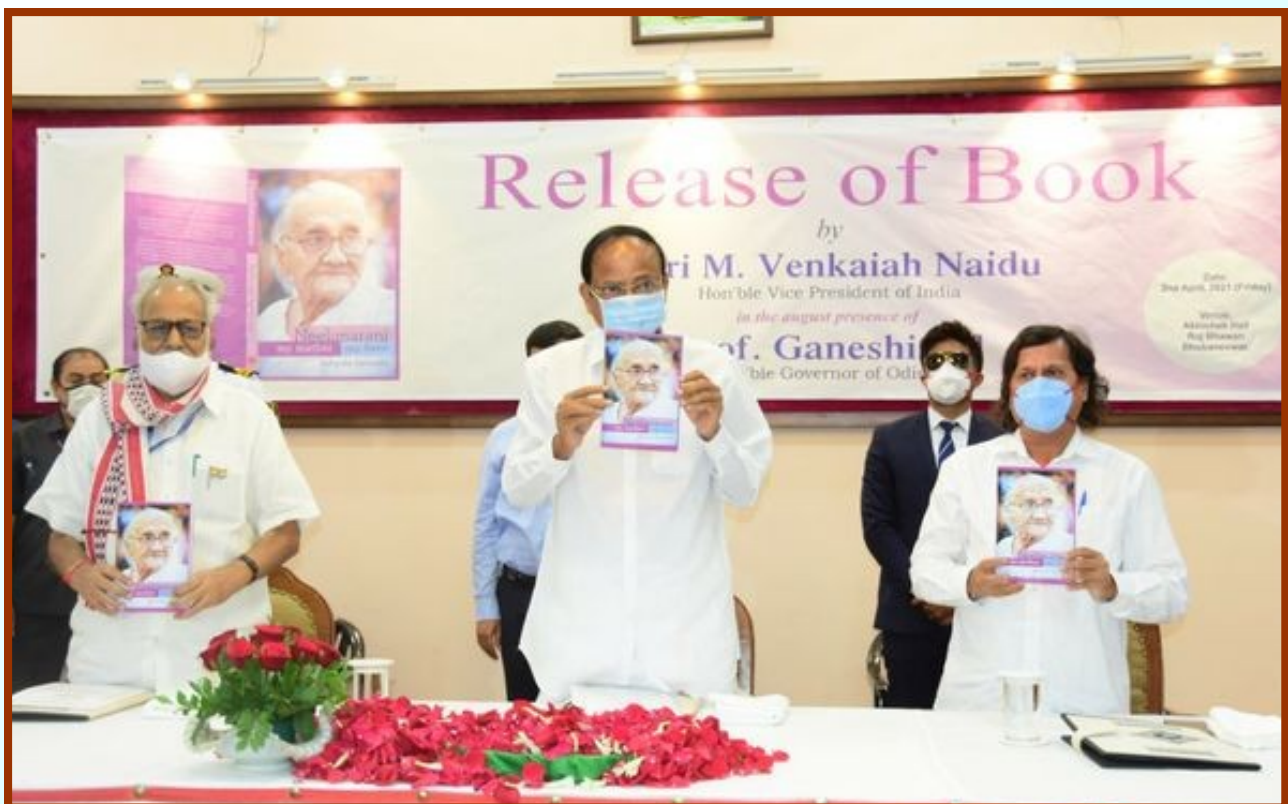
Release of book MY MOTHER MY HERO by Sri M. Venkaiah Naidu , Hon'ble Vice President of India in the august presence of Prof. Ganeshi Lal ,Hon'ble Governor of Odisha