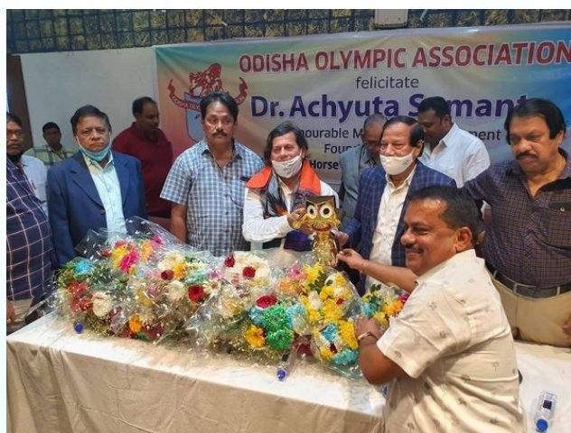
Felicitated by Odisha Olympic Association, Odisha Athletic Association and Odisha Volleyball Association for our contribution to sports in Odisha and India and being elected as the President of the Volleyball Federation of India